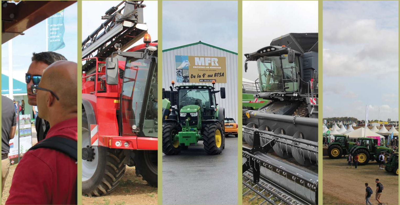
Edition janvier 2022